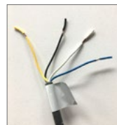
raccordement d'alimentation adaptable